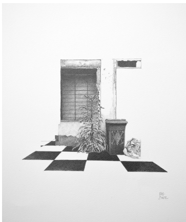
Limbes 30x40 cm graphite su papier, 2022