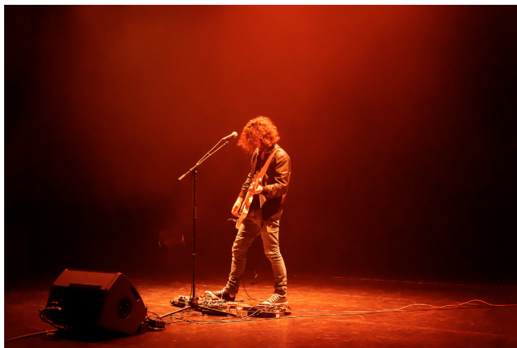
«Paranoid Summer» live @ Espace Paul Jargot. Photo Jessica Ducrocq